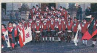
Der FZ Bregenz - einst und heute.

der Festumzug durch die Seeanlagen zum Festspielhaus statt. Dort werden dann die Fanfarenzüge noch einzeln auftreten und für Stimmung sorgen. Am Abend des Pfingstsonntags, findet das Fest seinen Abschluss mit einem Konzert der Original Fidenen Mölltaler. Karten für sämtliche Veranstaltungen gibt es bei allen Vorarlberger Hypo-Banken. Der FZ Bregenz hat zu seinem Jubiläum auch eine