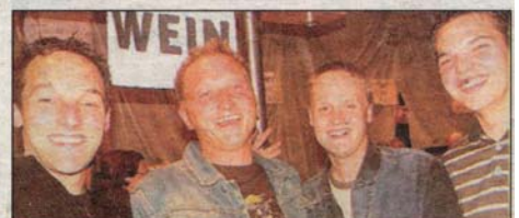
Die Gassarassler Rorschach.