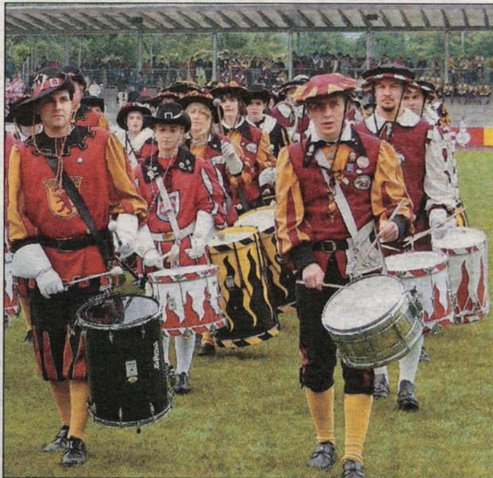
Eine tolle Show bekamen die Zuschauer im Bodenseestadion geboten.

Fanfarenzüge aus nah und fern, rund 1500 bunt gekleidete Musiker, die mit Fanfa-