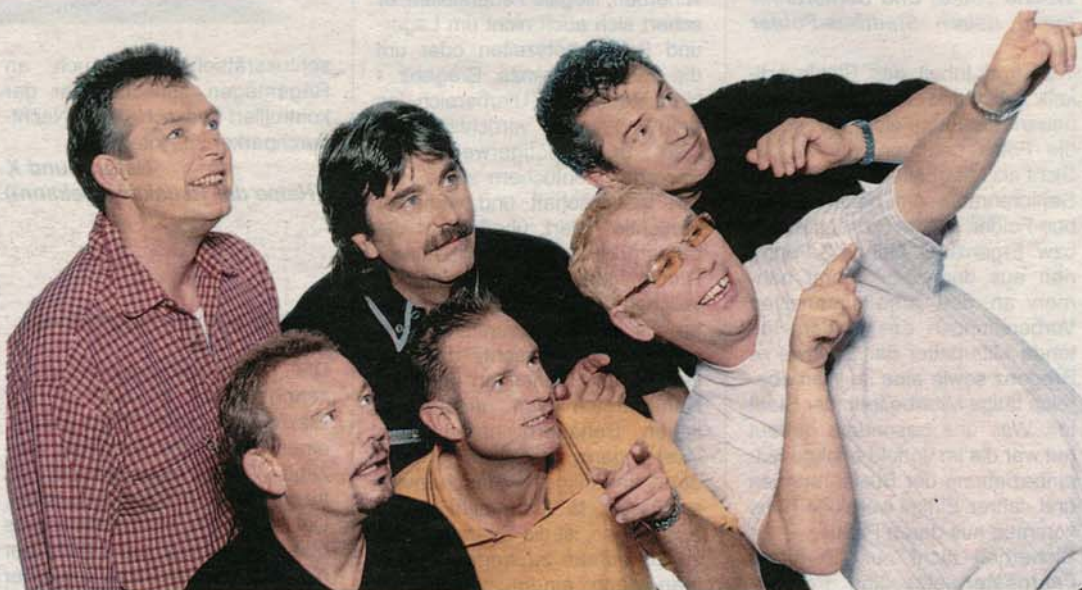
Spider-Murphy-Gang: Morgen am Freitag, dem 2. Juni, live auf der Werkstattbühne.

Am Sonntag-Vormittag laden die FZ'ler zum Frühschoppen mit Charly's Partyband ein und am Nachmittag, ab 13.30 Uhr werden beim Gemeinschaftsspiel , erstmalig in Österreich ca. 1.500 Fanfarenbläser, Trommler und Fahenschwinger gemeinsam im Bodenseestadion auftreten. Der anschließend stattfindende Umzug stellt einen weiteren Höhepunkt des Festes dar.