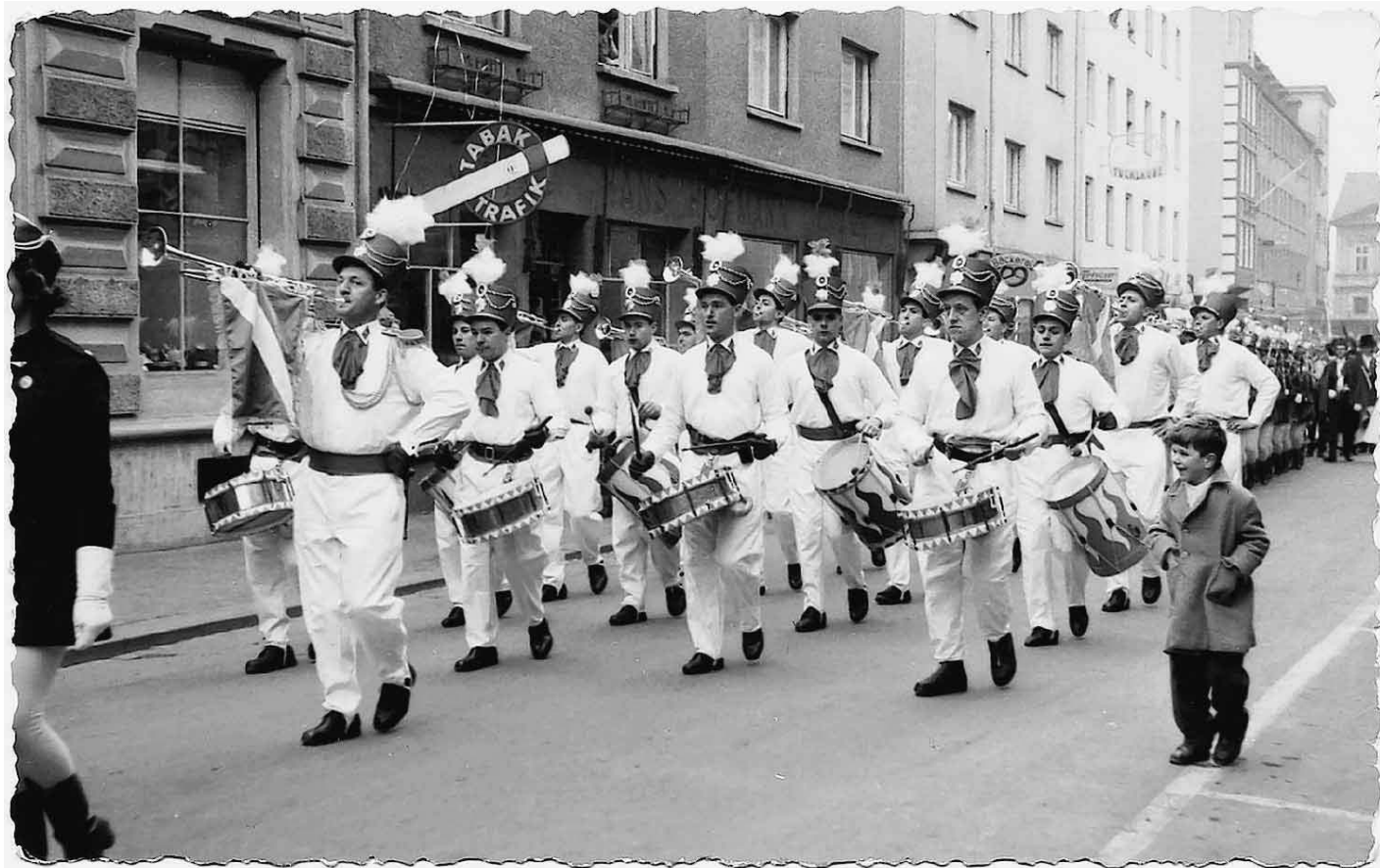
Seit 50 Jahren erfreut der Fanfarezug Bregenz mit seiner traditionellen Fanfarenmusik und munteren modernen Stücken bei Festen und Umzügen. An Pfingsten feiert er ein gigantisches Geburtstagsfest in Bregenz.