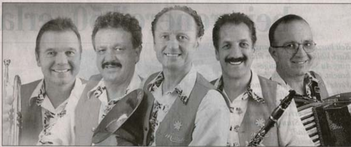
Stimmung pur gibt es am Sonntag, 4. Juni, mit den „Original Fidenen Mölltalern“.