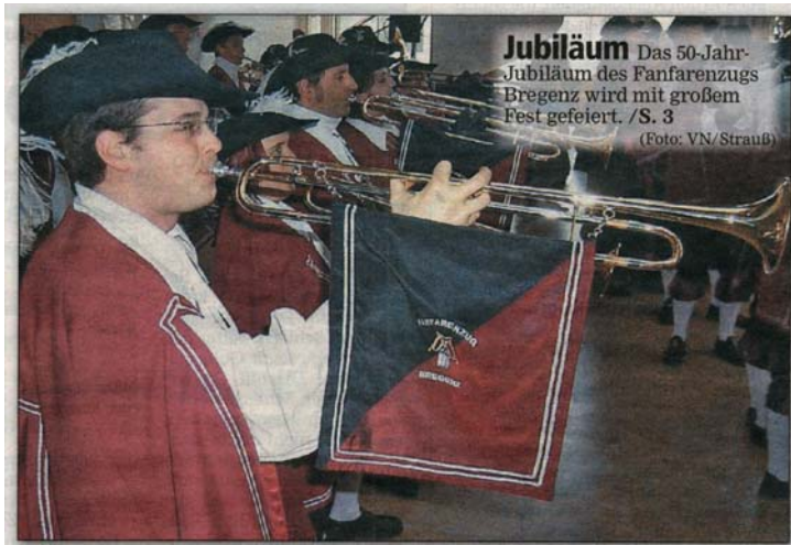
Jubiläum Das 50-Jahr-Jubiläum des Fanfarezugs Bregenz wird mit großem Fest gefeiert. /S. 3