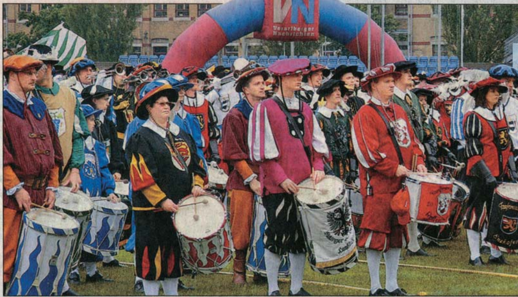
Fanfarenzüge mit rund 1500 Mitwirkenden gratulierten dem Bregenzer FZ. Natürlich waren auch die „VN“ dabei.