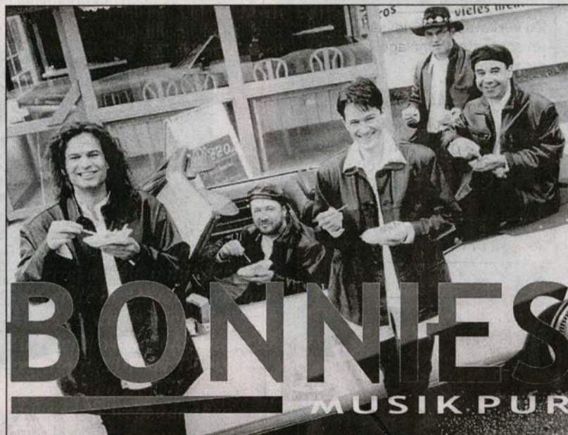
Party am Freitagabend mit den «Bonnies» und der «Spider-Murphy-Gang».

Das Programm zum Geburtstag hält lauter Highlights bereit: Morgen Freitag, 2. Juni, beginnt um 20.30 Uhr die Party mit den «Bonnies» und der «Spider-Murphy-Gang». Am Sams-