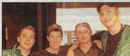
Der Lauteracher Schalmienzug.