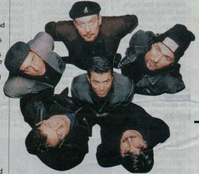
Spider Murphy Gang demnächst in Bregenz.