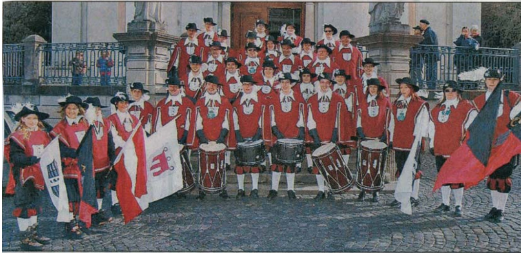
Der Bregenzer Fanfarenzug feiert sein 50-Jahr-Jubiläum von 2. bis 4. Juni.