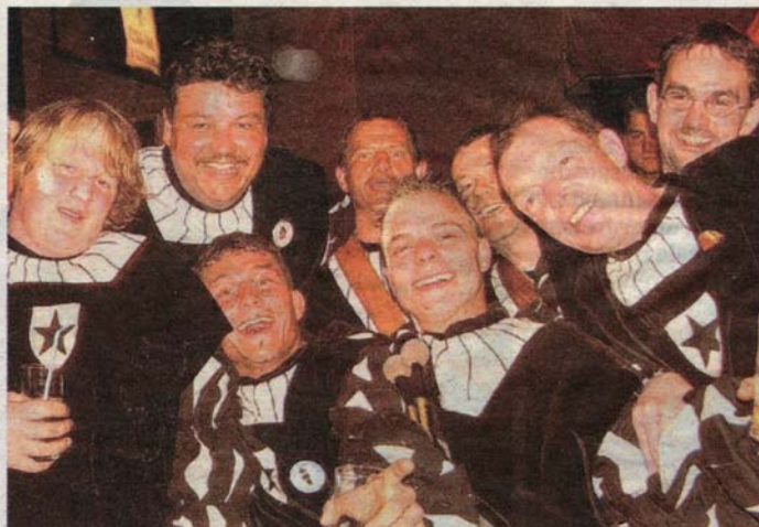
Es wurde ausgelassen gefeiert!

Fanfarenzüge aus Vorarlberg, Deutschland und der Schweiz sowie jede Menge Partytiger, Nachtschwärmer und Schaulustige feierten vergangenen Freitag bis Sonntag das 50jährige Bestehen des Bregenzer Fanfarenzugs . Anlässlich dieses Ereignisses fand in der Bregenzer Werkstattbühne ein Event der Superlative statt und jedermann erfreute sich an einem spektakulären und tollen Rahmenprogramm. Mit musikalischen Leckerbissen von den Bonnies , den Kult-Pop-Rocker Spider Murphy Gang , Charlys Partyband und den Original Fidelem Mölltalern standen auch Highlights wie der Umzug durch die Seeanlagen, ein Gemeinschaftsspiel mit ca. 1200 Mitwirkenden im Bodenseestadion und vieles mehr auf dem Programm. Petra Rauchegger