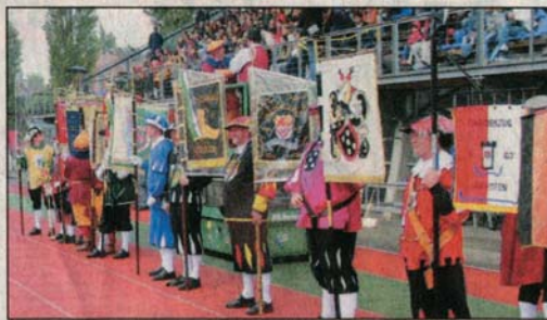
Vor der Tribüne hatten die Fahnenabordnungen Aufstellung genommen.