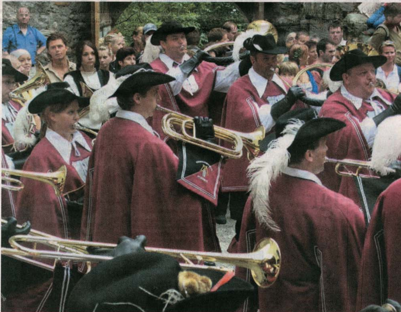
Feiert das 50-jährige Jubiläum: Der Fanfarezug Bregenz.